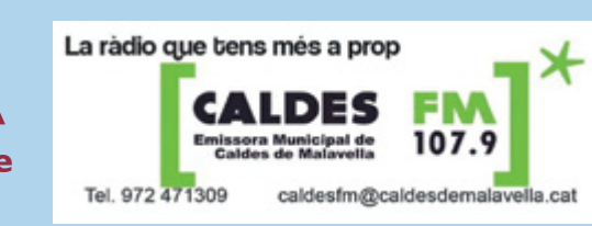
La ràdio que tens més a prop

TROBADA D'ESCOLES DE BÀSQUET A partir de 2/4 d'1 i, al Pavelló Municipal