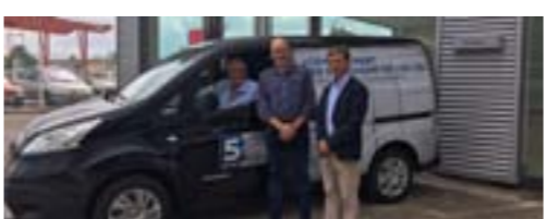
Cotxe elèctric de Nissan a la Diputació de Girona