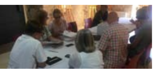
Treball de la licitació del SEMC

El passat 26 de juliol es va descobrir l'empresa guanyadora del servei del SEMC el curs 2017-2018 (prorrogable a un any). Va haver-hi dos candidats: La Mercè Rècords SL i Arreplec Cultura i Educació SL, que era l'empresa que fins ara gestionava el servei. Finalment va ser la primera la guanyadora amb 90,74 punts. Es valorava el projecte educatiu i model pedagògic; el projecte d'oferta formativa; el projecte d'organització i gestió de l'escola; a més dels mèrits de cada empresa. També es demanaven propostes de millora i participació en actes municipals. La Mercè Rècords SL també gestiona els estudis de música d'altres municipis com Tossa de Mar, Hostalric, Vidreres i Sils.