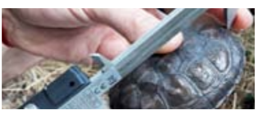
Treball de captura de tortugues a la riera de Santa Maria

A principis d'agost està previst que s'iniciïn les obres de soterrament del col·lector del clavegueram que passa per la riera de Santa Maria. Amb aquesta acció es millorarà la capacitat hidràulica de la riera i es reduirà l'impacte paisatgístic. Per protegir les espècies que hi viuen la Fundació Emys va estar fent tasques de captura. Es van repartir 13 trampes al llarg de la riera i es van aconseguir capturar prop de 130 tortugues, forces crancs americans, serps d'aigua, anguiles i fins a un visó americà. Després d'aquestes tasques s'espera reubicar les espècies autòctones i gestionar les espècies al·lòctones i invasores a més de fer un estudi sobre la tortuga de rierol.