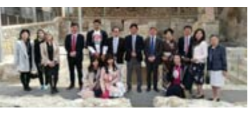
Grup d'empresaris japonesos a Caldes de Malavella

Després d'aquesta visita els empresaris han seguit en contacte amb l'Ajuntament. Ara han demanat permís per utilitzar el logotip del calderí de leslògan Malavella't per reivindicar al seva tradició termal i el seu propi logo de cares a les Olimpíades de Tòquio del 2020. La seva intenció és fer uns rellotges amb logotips de viles termals del món, entre elles Caldes de Malavella. No descarten tornar a visitar el municipi per tal de trobar la manera d'exportar la fórmula turística de Caldes a algun dels seus complexos hotelers.