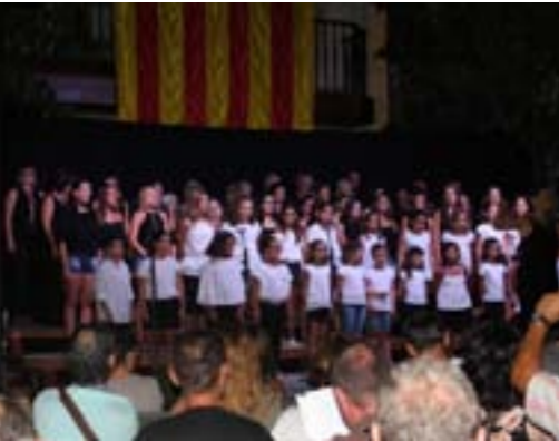
Concert de l'Orquestra Maravella a la Festa Major de Caldes de Malavella

més consolidades, com els concerts o el concurs de Pintura Ràpida també s'han superat les xifres de participació d'anys anteriors. De fet, el concert de l'Orquestra Maravella va acabar fent ple. Tot plegat és gràcies a l'esforç de tots aquells que treballen amb il·lusió per fer de la Festa Major un esclat d'alegria. Afortunadament el bon temps ha estat present tots els dies de festa (no s'ha hagut d'anul·lar cap acte per pluja). Amb tot plegat podem dir un GRÀCIES i FINS LA PROPERA!