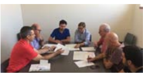
Treball de la fibra òptica a Can Carbonell

A partir del 9 d'agost les empreses Telefónica i Adamo van començar la pre fase per tal que tot Caldes, incloses les urbanitzacions, puguin tenir fibra òptica. Es preveu que properament es cobreixi tot el territori tot i que el servei arribarà més tard a Can Carbonell i al Tourist Club. Això suposa un impuls pel municipi perquè fins ara la connectivtat era molt baixa.