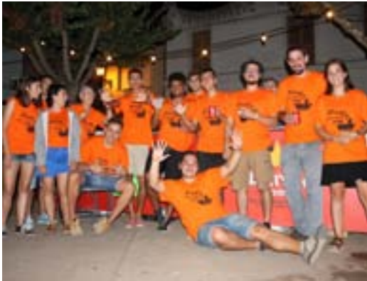
Joves intrèpids a la Festa Major de Caldes de Malavella

Des de la regidoria de Festes es vol agrair la participació a tothom que ha col·laborat en la Festa Major d'enguany. En especial als Joves Intrèpids, que fan 10 anys, també a les entitats i a tots els col·laboradors i voluntaris. Tampoc ens volem oblidar de tots els treballadors de l'Ajuntament, entre ells policia i brigada, que han hagut de fer un esforç extra i l'han fet de bon grat. Pel que fa participació fins i tot les novetats s'han omplert de gent, com és el cas del tobogan aquàtic o el concurs de pintura a l'asfalt. Quant a activitats