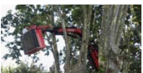
Treball de poda dels arbres de la Rambla Rufí

A finals de juliol es van estar podant els plàtans de les rambles Recolons i Rufí. A més de les podes de seguretat també es van tractar els 130 exemplars afectats pel tigre del plàtan (es pot veure quan un arbre està malalt perquè les branques es recargolen sobre sí mateixes). Es van col·locar caixes amb microinsectes que són depredadors naturals de la plaga esmentada. Aquest sistema no té cap afectació pel medi ambient ni per les persones i animals. Al cap de quinze dies ja es van notar millores. Aquesta actuació es fa en compliment a la nova normativa que aposta per reduir els productes químics combinant tractaments tradicionals amb la lluita biològica.